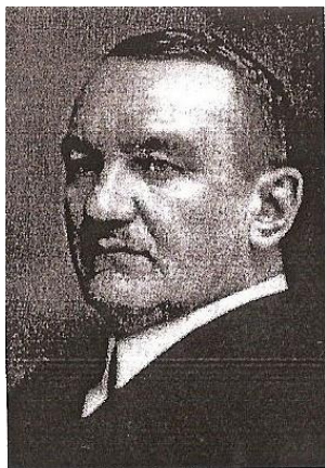
Prof. Dr. Dr. Willy Hellpach